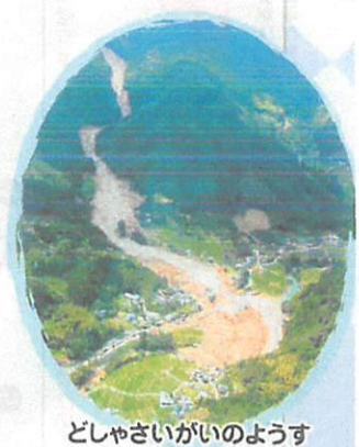
どしゃさいがいのようす

表彰 2020年3月中に国土交通省又は各都道府県において行います。 平成30年度の入賞作品は国土交通省砂防部Webサイトをご覧ください。 http://www.mlit.go.jp/mizukokudo/sabo/kaiga_h30.html